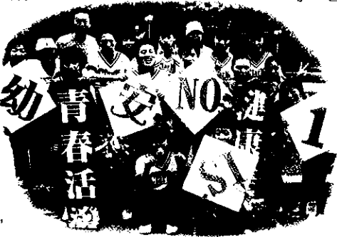
文／公關專員 劉珮筠

啦啦隊比賽是由台北市身心障礙服務推展協會、中華民國身心障礙服務推展協會所主辦，當天有各縣市國小、國中啟智班、高中職特教學校及機構，共計34隊、580人來到台灣民主紀念館廣場參與活動。幼安啦啦隊表演的勁歌熱舞，選自一連串的电音組曲，